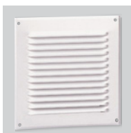
GRA-75 Reja exterior de aluminio.