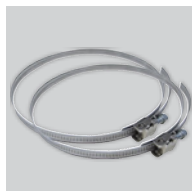
CX-80/125 Brida de sujeción.