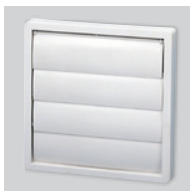
PER-100W Persiana de sobrepresión.