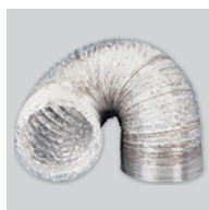
GSA-M0 100 Conducto flexible de aluminio.