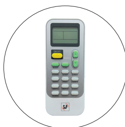
Control remoto inalámbrico con pantalla LCD