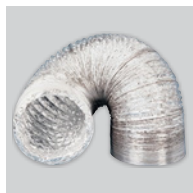
GSA-M0 100 Conducto flexible de aluminio.